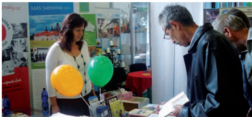
Země živitelka 2010