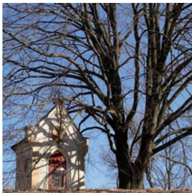
Kaplička Na Purku v Mirošově.

Nyní má příchozí možnost zastavit se v této uspěchané době a rozhlédnout se po okolí, pohlédnout vzhůru do mocné koruny, která toho již dost viděla a pamatuje, díky novým informačním tabulkám dozvědět něco z historie místa i samotného stromu, živého svědka historických událostí.