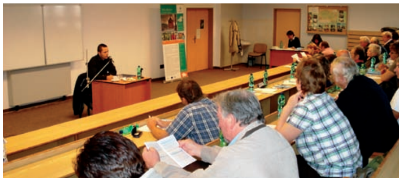
Školení pro obce