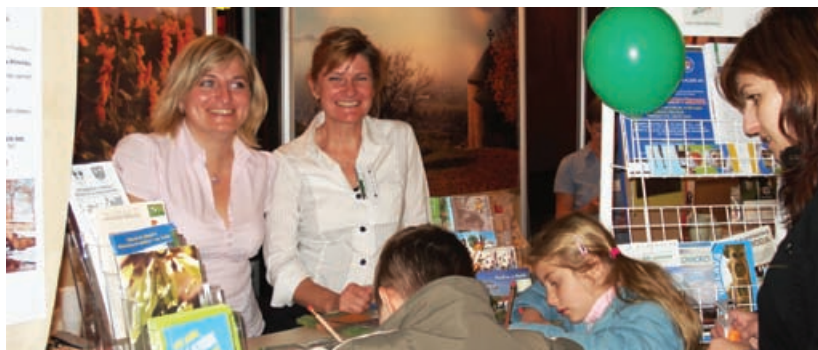
Veletrh cestovního ruchu v Plzni - ITEP 2010