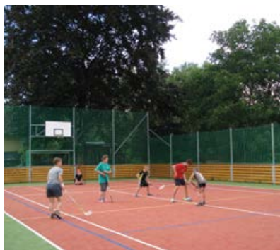
Víceúčelové hřiště v Lužanech