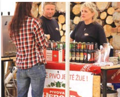
Každý si vybral ze široké nabídky minipivo-vařů