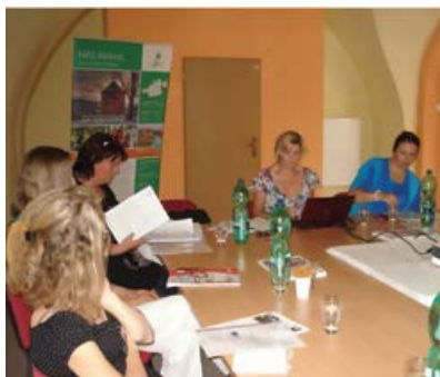
Školení pro žadatele v Přešticích

V roce 2012 byly vyhlášeny dvě výzvy – 8. Výzva SPL vyhlášena od 17. 4. 2012 do 18. 5. 2012. Proběhla dvě školení pro žadatele v úterý 17. 4. od 16,30 hod v Kulturním a komunitním centru v Přešticích a 19. 4. 2013 v 9,30 hod v zasedací místnosti MěÚ ve Starém Plzenci. Příjem žádostí o dotace se uskutečnil v Nezdicích od 16. 5. do 18. 5. 2012 v době od 8 do 16,00 hod. Celkem se přihlásilo 29 žadatelů, podpořeno bylo 18 projektů v celkové částce 4 953 124,- Kč.