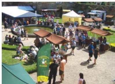
Celkový pohled do areálu zámku