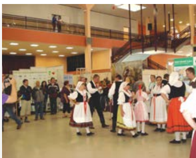
OS Aktivios prezentuje každoročně naše území na veletrhu Země živitelka v Českých Budějovicích společně s dalšími MAS Plzeňského kraje.