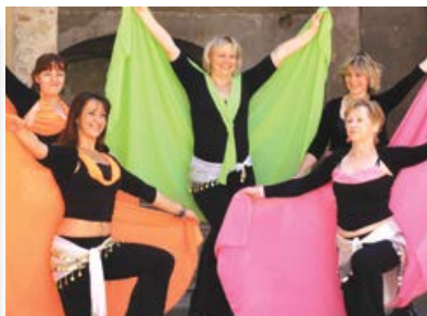
Vystoupení kurzistek orientálních tanců z tanečního studia