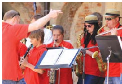
Májovou pěnu zahajoval dechový orchestr ZUŠ Přeštice

Ve vstupním prostoru zámku si bylo možné na sedmi panelech získat ucelený obrázek o celé činnosti našeho sdružení OS Aktivios a seznámit se s některými úspěšnými projekty, které jsme v uplynulých letech na našem území finančně podpořili.