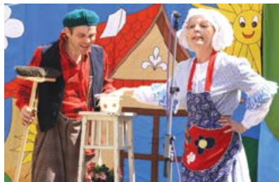
Divadelní spolek Kolem zahrál veselou pohádku pro malé diváky

V sobotu 26.května 2012 se konala na zámku Nebílovy „ Májová pěna “. Naše MAS OS Aktivios ve spolupráci se zámek Nebílovy chtěla návštěvníkům přiblížit a představit náš region jižní Plzeňsko. A protože typickým produktem oblasti Plzeňska je pivo, oslovili jsme řadu malých místních pivovarů. Přijeli pivovary Bizon Čížice, Radouš Štáhlavy, Modrá Hvězda Dobřany, U Stočesů Rokycany, Herold Březnice, Purkmistr Plzeň-Černice, Zámecký pivovar Chyš, Pašák Plzeň, U rytíře Lochoty Plzeň, z hostů pak pivovar Tascheberg z Buštěhradu, Domácí pivovárnek Velký Rybník a Belveder Železná Ruda.