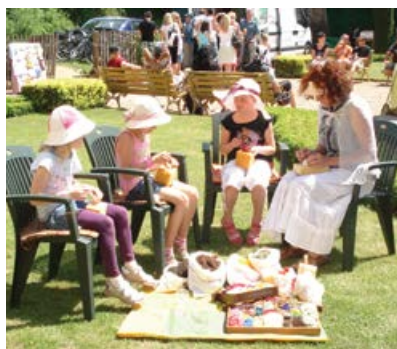
Nechyběly ani tvůrčí dílny pro děti – výroba šperků z vlny